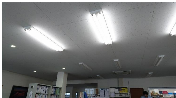
不使用蛍光灯の電源OFF