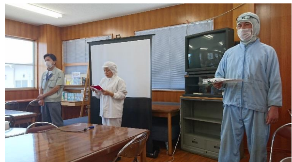
<安全・衛生委員会の様子>