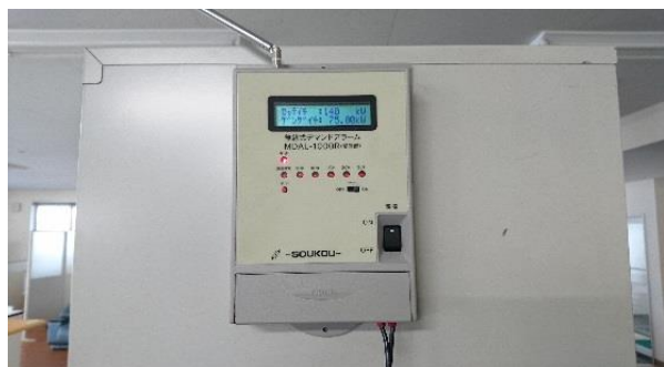
デマンド監視装置