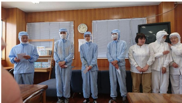
<全体ミーティングの一例>