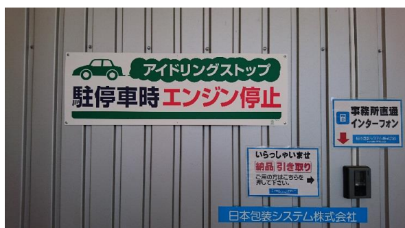
アイドリングストップ看板の設置