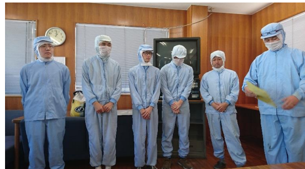
<生産技術課の発表の様子>